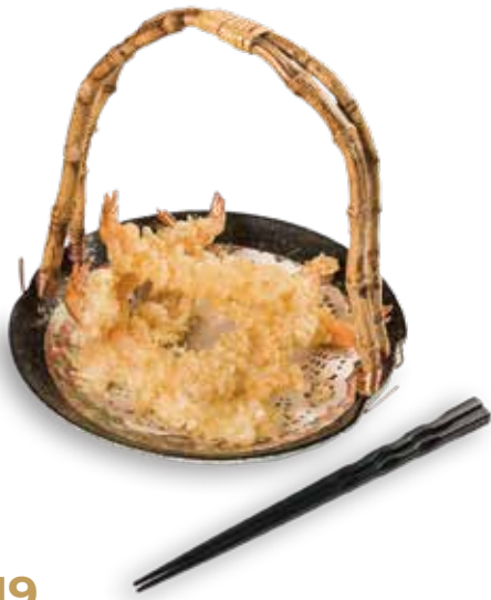
19 EBI TEMPURA - 3PZ Tempura di gamberi* € 8.80