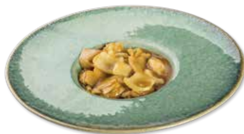
183 POLLO SALSA AL CURRY Pollo*, cipolla, salsa al curry € 6.00