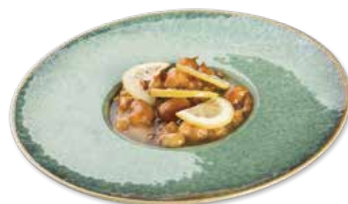
185 POLLO AL LIMONE Pollo* fritto, limone, salsa limone € 6.00