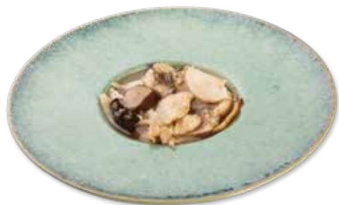
180 POLLO FUNGHI E BAMBU Pollo*, funghi, bambù € 6.00