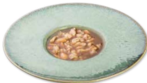
181 POLLO ALLE MANDORLE Pollo*, mandorle € 6.00