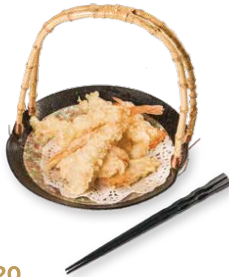
20 TEMPURA MORIAWASE Tempura di verdure miste e gamberi* € 6.50