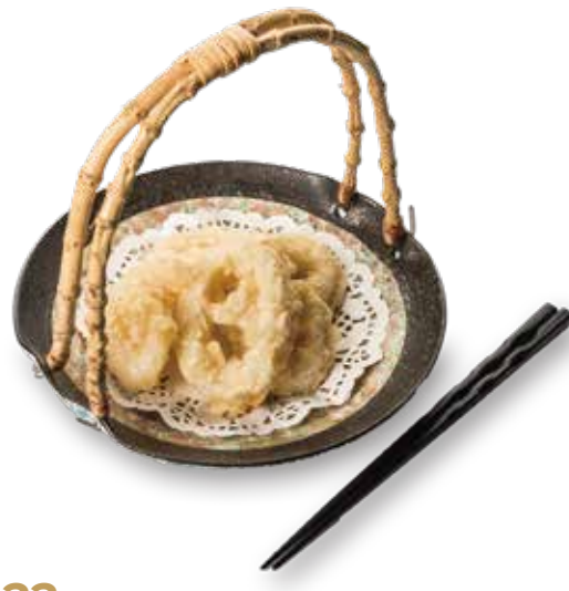
22 IKA TEMPURA Tempura di calamari* € 4.00