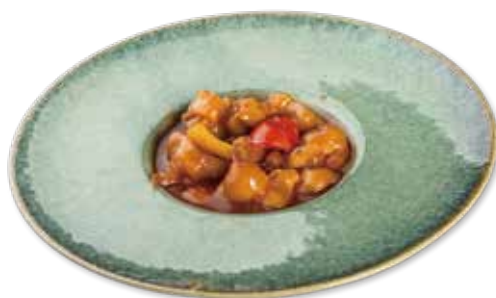
182 POLLO AGRODOLCE Pollo* fritto, ananas, peperoni, salsa agrodolce € 6.00