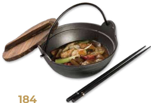
184 POLLO AL PICCANTE 🌶️ Scodella di fuoco con pollo*, peperoni, cipolla, salsa piccante € 6.00